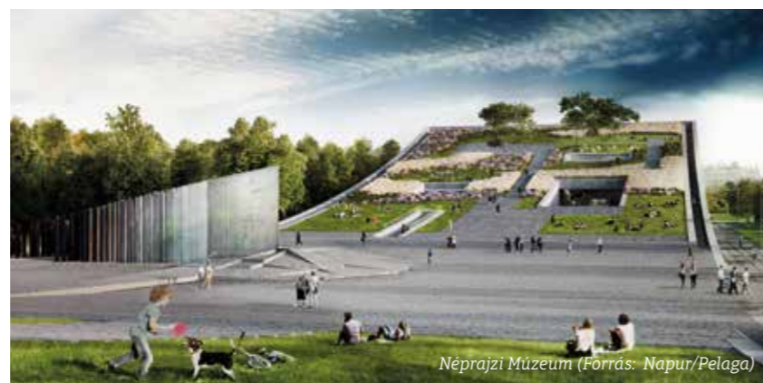
Néprajzi Múzeum

A 145 éves Néprajzi Múzeum páratlan etnográfiai gyűjteménye most először kap olyan épületet, melyet úgy terveztek meg, hogy létrehozza a 21. századi látogatói élményt. A múzeum egy korszerű, minden szempontból világszínvonalú, a szakmai követelmények, valamint gyűjteményi és látoga-