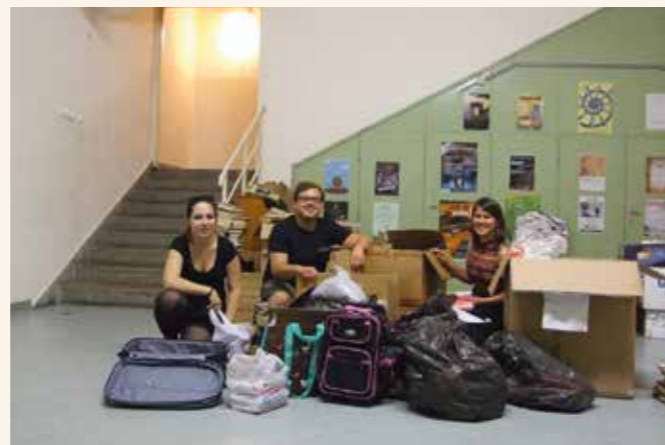
Az alapítvány legutóbbi adománygyűjtő akciójában az ELTE BTK segített

Mindig köszönettel és hálával tartoznak a támogatóknak és adakozóknak, akik a közhasznú szervezeten keresztül számos szegény sorsú gyermeket, tehetséget és ezáltal családokat is támogathatnak.