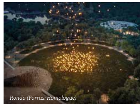
Rondó

A Liget Budapest Projekt tájépítészeti tervei szerint a parkrészt jövőbeli szerepe azonos marad az eredetivel: a sétát, pihenést fogja szolgálni, megújulnak a köríves utak, melyeket zöld szigetek fognak körül, a most hiányos, kettős fasor pedig újra teljes lesz. A Rondó kettős fasora jelenleg hiányos, éppen ezért a jövőben a fasorokat is kiegészítik majd. A belső gyeperes kör helyreállítása az egyik legfontosabb feladat, továbbá rekonstrukcióként visszaállítanak a korábbi kilenc félköríves „beharapásból” hetet, padokkal, cserjékkel, amely meghatározó eleme volt és lesz a terület belső zónájának. A megújult Rondó nagyobb hangsúlyt kap a Liget Dózsa György úti részén, hiszen ezt a területet körül fogja majd a Néprajzi Múzeum új épülete, ezáltal hangulatos közösségi térként „tér vissza” a Liget régi-új kapuja.