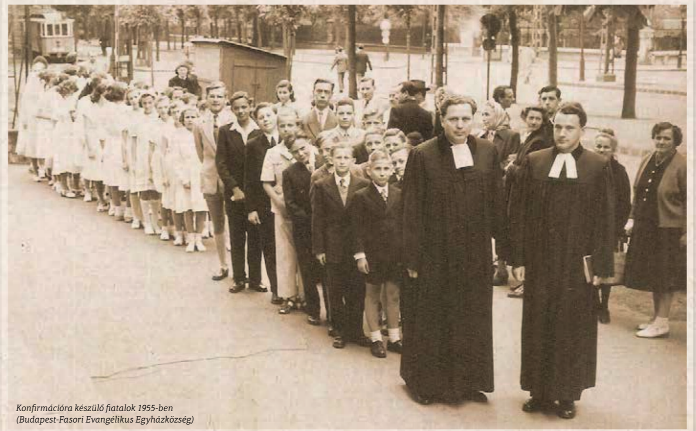
Konfirmációra készülő fiatalok 1955-ben (Budapest-Fasori Evangélikus Egyházközség)